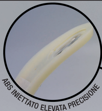
ABS INIETTATO ELEVATA PRECISIONE