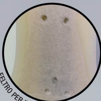
FELTRO PER INCOLLAGGIO